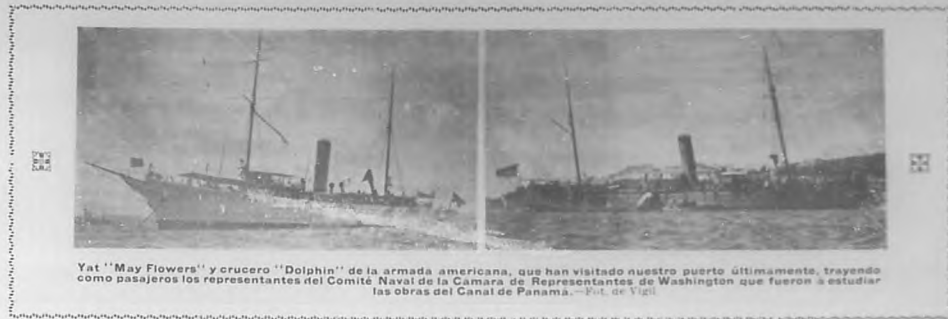
Yat "May Flowers" y crucero "Dolphin" de la armada americana, que han visitado nuestro puerto últimamente, trayendo como pasajeros los representantes del Comité Naval de la Cámara de Representantes de Washington que fueron á estudiar las obras del Canal de Panamá. —Pub. de Yacht.

Del joven Jefe de Redacción de nuestro querido colega "Cuba y América", autor de obras