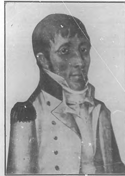
MANUEL DE ZEQUEIRA Y ARANGO.

Entre otros detalles curiosos, contiene el escrito en que hasta ahora anduve espigando, una interesante alusión á las migas, definidas por el colegio belemita como escuelas que dan las vejas para vivir con el costo estipendio de los discípulos ; pero renuncio á traspasar, solo ó en compañía del lector, los umbrales de aquellas aulas, porque amén de que en ellas nada habríamos de aprender que ya no nos hubierat enseñado los venerables sacerdotes anteriormente citados, con la prueba testifical que precede basta para proveer en última instancia que fueron muy menguadas las fuentes en que pudo abreviar su sed de cultura aquella porción de la familia cubana, que aguijoneada por el impulso im-