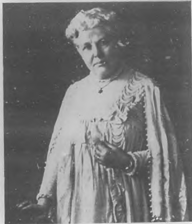
MRS. ANNIE BESANT Presidente de la Sociedad Teosófica.

Estas notas de actualidad tienen el interés de lo nuevo; y como tal no