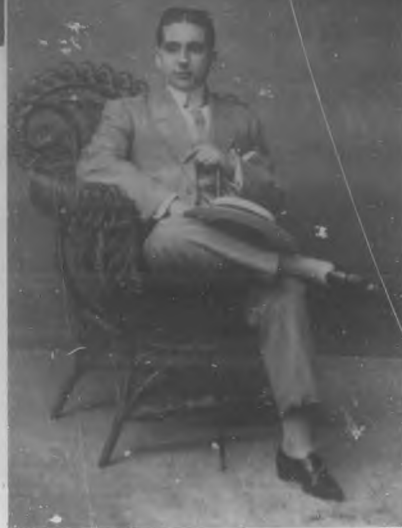
LA SOCIEDAD FILOMATICA CUBANA