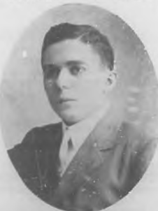
Sr. Emilio Roig de Leuchsenring