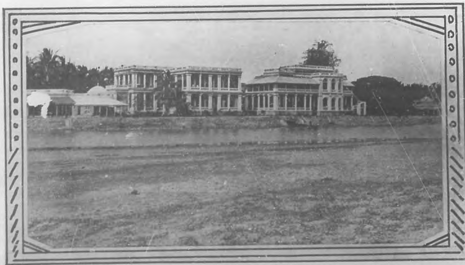
CUARTEL GENERAL DE LA SOCIEDAD TEOSOFICA Y DE LA ORDEN DE LA ESTRELLA DE ORIENTE, ADYAR, MADRAS, INDIA.

vedad las ofrecemos á nuestros lectores que pronto por la prensa se enterarán de la campaña que en Norte América hará una mujer, Mrs. Annie Besant, Protector "de la Estrella de Oriente" y Presidente de la Sociedad Teosófica.