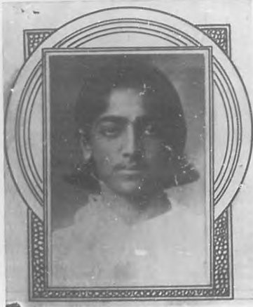
J. KRISHNAMURTI (Alcione) Jefe de la Orden de la Estrella de Oriente

YA el lector habrá tenido noticias, por la prensa en general, de la aparición en la India de un Mesías que preocupa grandemente la atención y que, siendo muy joven aún, pues apenas tiene diez y ocho años, ha escrito una obra de gran resonan-